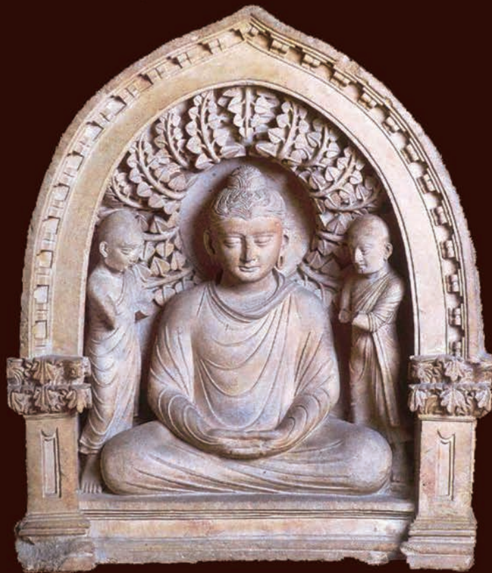
「ウズベキスタン共和国の三尊仏」1世紀 テルメズのファヤズテバ この像はウズベキスタンの仏教美術の最高傑作とされています。ファヤズテバはユネスコ日本信託基金プロジェクトによって修復されました。